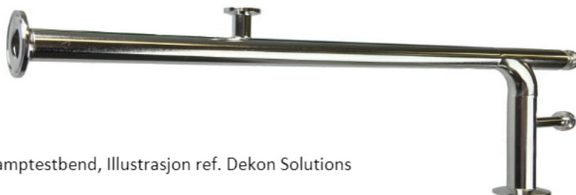
Damptestbend, Illustrasjon ref. Dekon Solutions